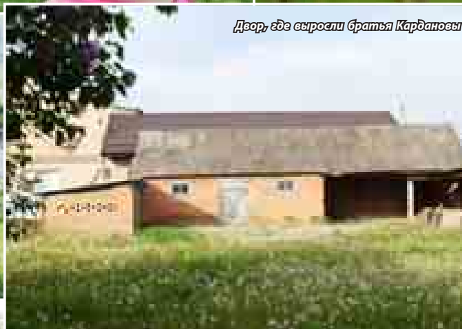
Двор, где выросли братья Кардановы