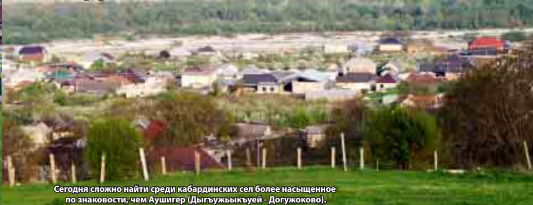
Сегодня сложно найти среди кабардинских сел более насыщенное по знаковости, чем Аушигер (Дыгъужькъуей - Догужоково).