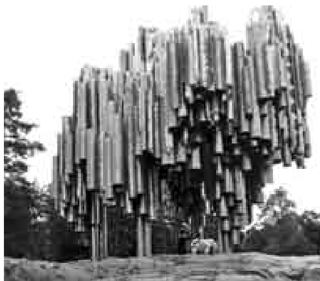
Памятник музыке Яна Сибелиуса