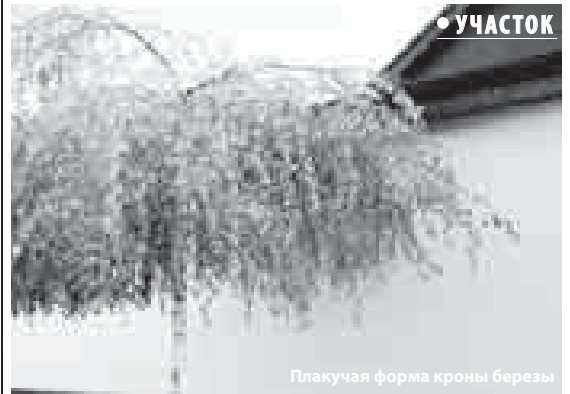
Плакучая форма кроны березы