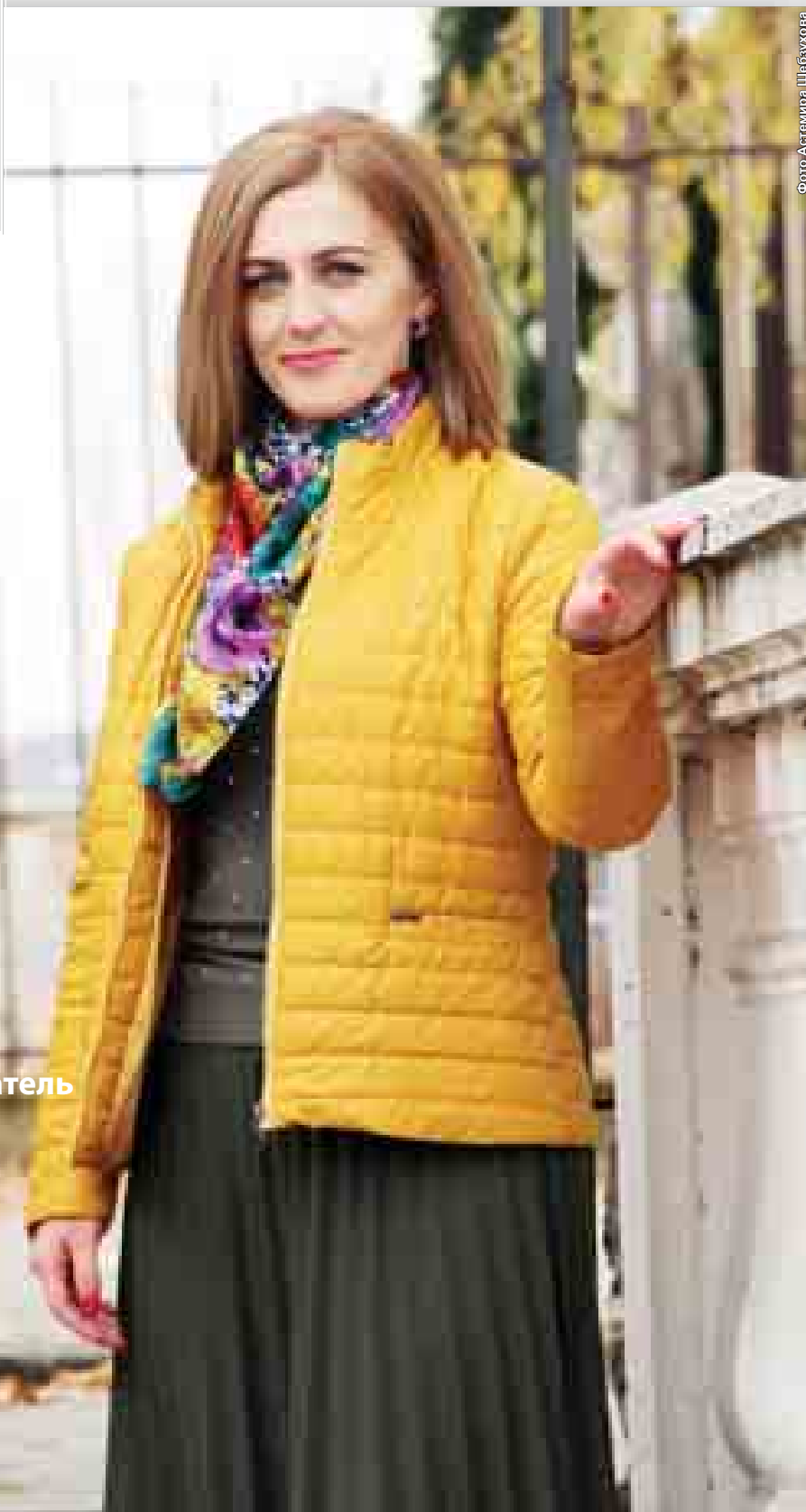
фото Астемира Шибзухова