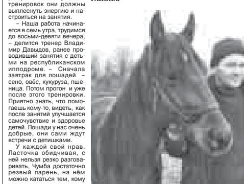
Шотландский пони Фиона, помесные кабардинские лошади Чумба и Пасточка перед каждой тренировкой с детьми обязательно проигрываются, рвываются на специально отведённой для этой территории. К моменту начала тренировки они довольно выносливы и настраиваются на занятия.

МЯГКИЕ, ТЁПЛЫЕ, КАЖДЫЙ СО СВОИМ ХАРАКТЕРОМ, НАСТРОЕНИЕМ И ВСЕ ПОМОГАЮЩИЕ ДЕТКАМ СТАТЬ ЗДОРОВЕЕ. ТРОЕ «ЧЕТВЕРОНОГИХ ЛЕКАРЬ» ЖИВУТ В РЕСПУБЛИКАНСКОМ ФИЛИАЛЕ ЭПАХИАЛЬНОГО ЦЕНТРА ЛЕЧЕБНОЙ ВЕРХОВОЙ ЕЗДЫ «ЦЕЛЕВЫЙ ЭССЕНТУИ» «БЛАГОВЕЩЕНСКИЙ», РАСПОЛОЖЕННОМ В С. БЛАГОВЕЩЕНСКОМ ПРОХЛАДНОГО РАЙОНА.