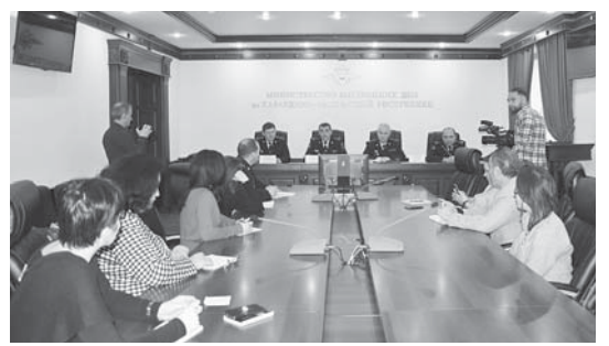
С начала года в КБР зарегистрировано 39 «дистанционных» фактов мошенничества.