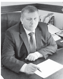
(Окончание. Начало на 1-й с.)

И четвёртое – это обеспечение гарантированной эффективной парадигмы продвижения и позиционирования, что включает рыночные исследования, экспортный маркетинг и коммуникации.