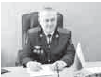
В нашей республике транспортная милиция была создана по приказу МВД СССР от 30 мая 1949 года.

18 февраля 1919 года был подписан декрет «Об организации железнодорожной милиции и железнодорожной охраны». С тех пор сотрудники органов внутренних дел на транспорте остаются на переднем плане борьбы с преступностью.