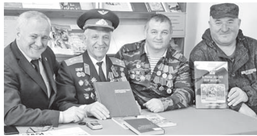
РФ. В настоящее время работает преподавателем в Кабардино-Балкарском центре повышения квалификации по ГО и ЧС.

«Защита Родины – священный долг» – урок мужества под таким названием провел для молодёжи публичный центр правовой информации Государственной национальной библиотеки КБР им. Т.К. Мальбахова. Его цель – содействие формированию патриотизма как важного качества личности молодого гражданина России.