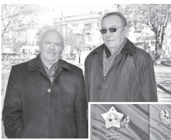
Во второй книге «О долести и славе» до сведения читателей доводится награжденные орденом Славы в тридцать два уроженца Кабардино-Балкарии или длительное время проживавших на её территории в послевоенное время, которые за мужество и героизм, проявленные в боях с немецко-фашистскими захватчиками, были награждены полководческими орденами: орденом Суворова – троим; орденом Кутузова – трем; орденом Богдана Хмельницкого – четверо; орденом Александра Невского – 22 человека (из них трое – сотрудники милиции).