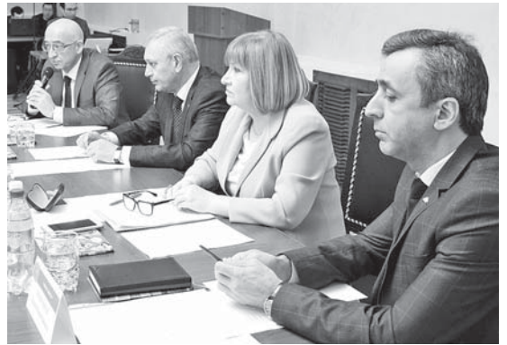
ационного кластера «Черек» и кластера «Тамбукан».