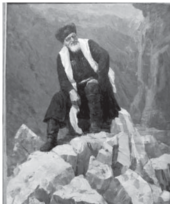
Залы музея заполнили живописные, графические, скульптурные произведения, а также работы декоративно-

прикладных видов искусства – кийзы, национальный костюм, музыкальные инструменты, выражающие авторское понимание красоты, родившееся на основе традиций прошлого.