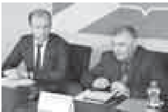
Формы команды должны выйти чертвяк - четыре тура...