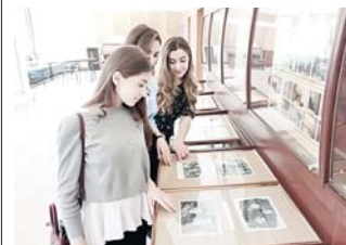
Выставка организована республиканским отделением партии «Единая Россия» и Кабардино-Балкарской региональной общественной организацией «Патриот»...