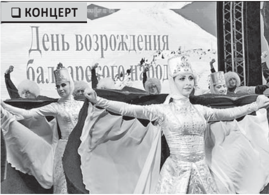
(Окончание. Начало на 1-й с.)

Зал то и дело поднимал волну оваций, когда на сцену выходили танцоры фольклорно-этнографического государственного ансамбля «Балкария», поистине дитяща возрождённого, подносящегося к новым духовным высотам балкарского народа.