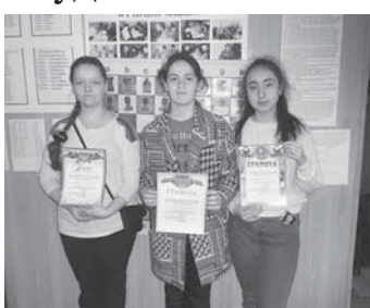
Материалы рубрики подготовил Альберт ДЫШКОВ