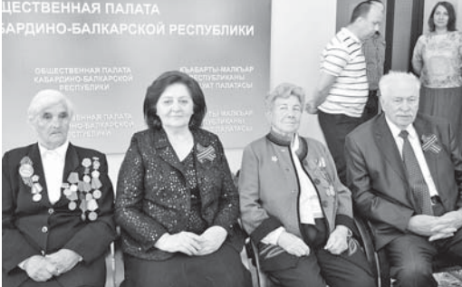
Общественная палата Кабардино-Балкарской Республики

Пятый год подряд Общественная палата Кабардино-Балкарской Республики и бывшими малолетними узниками фашистских концлагерей. Сейчас в КБР живут 38 человек, которые детьми пережили все ужасы концлагерных застенков.