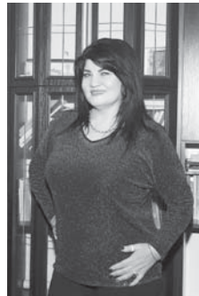
Иногда её репертуар пополняется совершенно неожиданно.