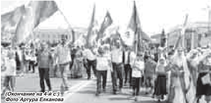
(Окончание на 4-й с.).

Относительно новый в истории страны праздник «День России» в Нальчике третий год подряд отмечает красочным многонациональным шествием «Парад дружбы народов России». В этом году он прошёл более чем в 40 регионах России. В Нальчике в шествии приняли участие около девяти тысяч человек.