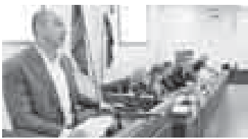
(Окончание. Начало на 1-й с.)