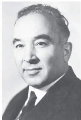
Алим Кешоков – народный поэт КБАССР, лауреат Государственных премий СССР и РСФСР, Герой Социалистического Труда

1924 г. – в Кабардино-Балкарии появились первые тракторы.