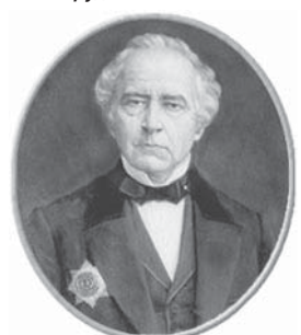
Академик РАН Адольф Купфер – член научной экспедиции на Эльбрус 1829 г. Составил научное описание минеральных источников Эльбруса.

1924 г. – родились Герои Советского Союза Н.И. Двуреченский и Ш.М. Машкауца.