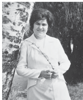
Танзила Зумакулова – народный поэт КБАССР, лауреат Государственных премий РСФСР и КБАССР