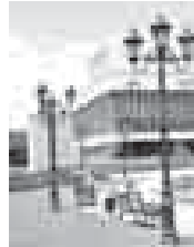
Целью проекта является знакомство театральной публики и широкого круга российских зрителей с наиболее интересными тенденциями современного театрального искусства и произведениями зарубежных драматургов, а также содействие развитию международных связей в области театра и укрепления имиджа России как одного из крупнейших центров мировой театральной культуры.