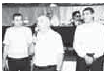
Победители и участники турнира по настольному теннису