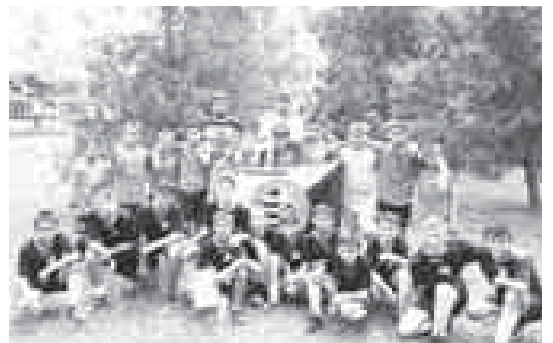
Футбольная школа «Нальчик» в г. Анапа.