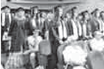
на форуме «Трудовой доблести России»