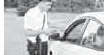
Машина врезалась в бордюр, нарушитель задержан. Оказалось, у него «дежентельный набор»: отсутствие прав и состояние опьянения.