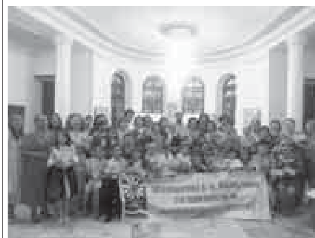
Дню семьи, любви и верности, который отмечается в нашей стране 8 июля, был посвящён цикл мероприятий женской общественной организации Столицы Кабардино-Балкарии. Он прошёл в рамках VIII Всероссийской акции «Добровольцы – детям».