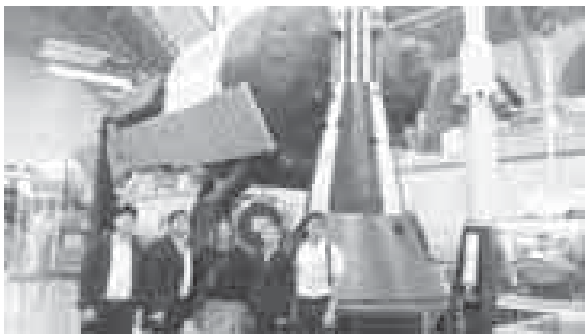
В Государственной Думе РФ подвели итоги VI Всероссийской конференции «Юные техники и изобретатели». Среди победителей – воспитанники Детской Академии «Солнечный город».

В награждении приняли участие школьники из 77 регионов страны, увлекающиеся естественными науками, проявляющие незаурядные технические способности и представившие на конкурс оригинальные технические проекты и изобретения. Конкурсом было предусмотрено 25 номинаций, для участия в которых юными учёными из всех уголков страны представлено тысячи работ. Организаторами проделана большая работа по отбору лучших из них.