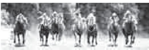
Предстоящая суббота на нальчикском ипподроме обещает быть жаркой. Да и как иначе? Ведь наступает пора самых главных скачек сезона.

13 июля трибуны станут свидетелями розыгрыша традиционных призов первой, второй и третьей групп на лошадей чистокровной верховой породы: реки Кубань, Ангилана, Гранита-2, Жюей-Клуба. Но главным событием в скаковом мейне - нальчикской ОКС, или как его называют конники - «Кобальде Дерби».