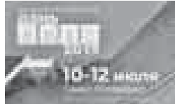
Делегация Кабардино-Балкарии принимает участие в работе сельскохозяйственного форума «Всероссийский день поля-2019», который проходит с 10 по 12 июля

на площадке производственного полигона Санкт-Петербургского государственного аграрного университета в г. Пушкине Ленинградской области.