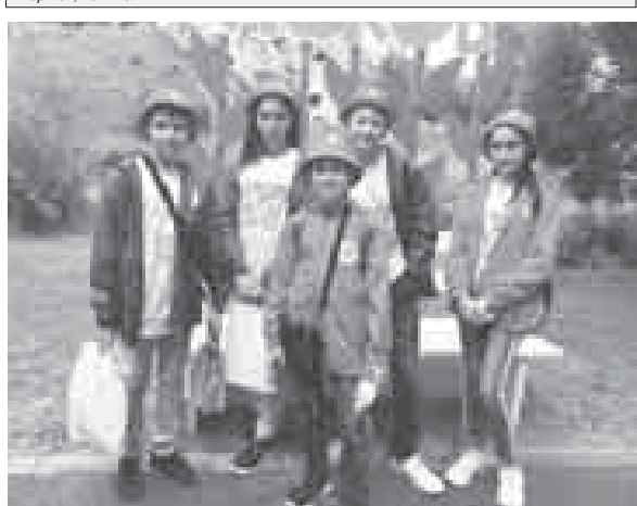
Юные музыканты из Кабардино-Балкарии приняли участие в XXXIX фестивале «Международные Ганзейские дни Нового времени».

Культурное сотрудничество городов Ганзей объединяет более 180 городов из 16 европейских государств. В их числе Белозерск, Великий Новгород, Великий Устюг, Вологда, Ивангород, Калининград, Кингисепп, Псков, Смоленск, Тверь, Тихвин, Торжок, Тотма.