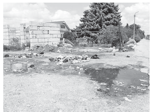
г. Нарткала, пересечение ул. Ахметова и Балкарской

По материалам ОНФ подготовила Ольга КЕРТИЕВА