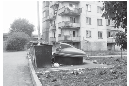
г. Нальчик, ул. Эльбрусская, 1-а. Заглубленный контейнер не действует

Активисты Общероссийского народного фронта в Кабардино-Балкарской Республике обратились в администрацию Нарткала и Нальчика с просьбой принять меры и убрать несанкционированные свалки в жилых районах. Проблемные участки неравнодушные горожане отметили на ресурсе проекта ОНФ «Генеральная уборка/Интерактивная карта свалок».