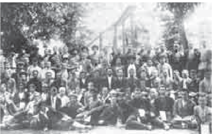
Слушатели областных курсов пионервожатых, г. Нальчик, 1932 г.

1990 годов единая всесоюзная организация распалась, на её смену пришло множество различных детских организаций.