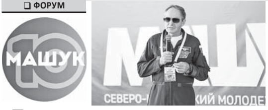
СЕВЕРО-КАВКАЗСКИЙ МОЛОДЕЖНЫЙ ФОРУМ «МАШУК-2019»