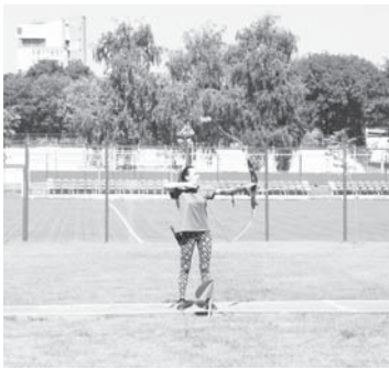
Победителями и призерами республиканского этапа Фестиваля культуры и спорта народов Кавказа стали: