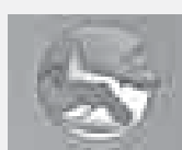
Праздничные мероприятия также пройдут во всех районах республики.

21 СЕНТЯБРЯ Конноспортивный праздник, посвящённый Дню адыгов (черкесов). Место проведения: республиканский ипподром. Начало в 12 часов.