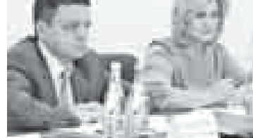
(Окончание на 2-й с.).