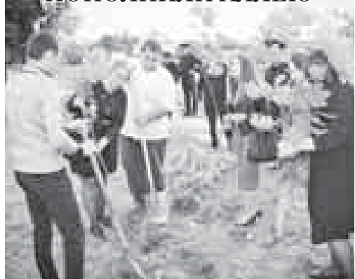
Подготовила Илана КОГОТЖЕВА