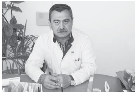
Умам прибавляется ещё и современное техническое оснащение – медицина поднимается на новый профессиональный уровень, так

необходимый простым людям, которых в нашей стране – подавляющее большинство.