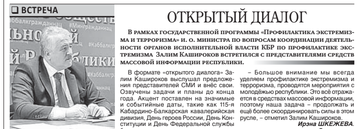
Оксана СОКОЛОВА. Фото автора