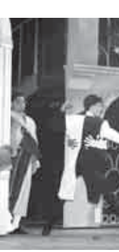
Показ прошёл на сцене Государственного Музыкального театра КБР. На фоне лаконичных, но очень функциональ-

ных декораций развернулось невероятное смешанное и интересное действие, которое, несмотря на холодное время года, принесло в зрительный зал атмосферу солнечных Испании и Италии.