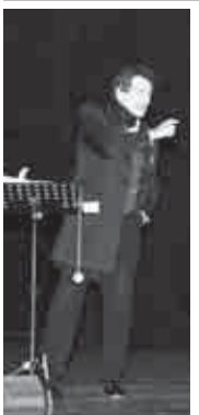
Моноспектакль по мотивам повести Александры Сергеевны Пушкина «Никова дама»...