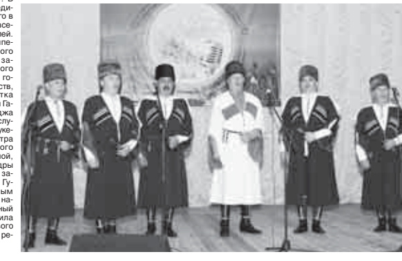
Выбор перед жюри стоял действительно нелегкий, ведь каждое выступление было продемонстрировано красочной народной песней, многообразием национальных языков и культур.

В Нальчике в Государственном концертном зале прошёл финальный республиканский этап фестиваля-конкурса любительских творческих коллективов Кабардино-Балкарской Республики в рамках регионального проекта «Творческие люди» национального проекта «Культура».