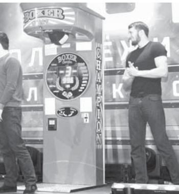
Поздравляю всех победителей и призёров турнира. Работы показали бескомпромиссный, зрелищный и интересный бокс, за которым было приятно наблюдать. Отдельно хочу обратить внимание на неподдельные эмоции наших молодых боксёров. Сейчас мы воочию убедились, что у главной сборной России есть очень хорошие резервы. Хотя называть «резервом» 23-летним ребят, пожалуй, будет неправильно. Многие из этих боксёров уже ступают в двери главной национальной команды, они составят достойную конкуренцию более возрастным боксёрам.