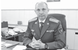
Пресс-служба Главного управления МЧС России по КБР