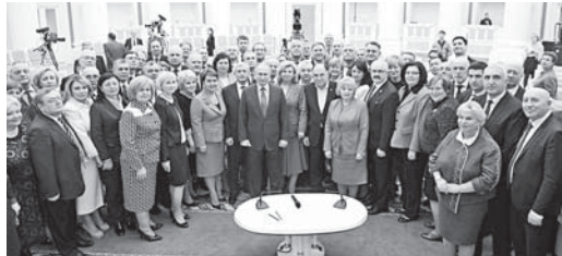
Встреча с удовлетворением отменялось, что благодаря поддержке федерального центра и лично Президента