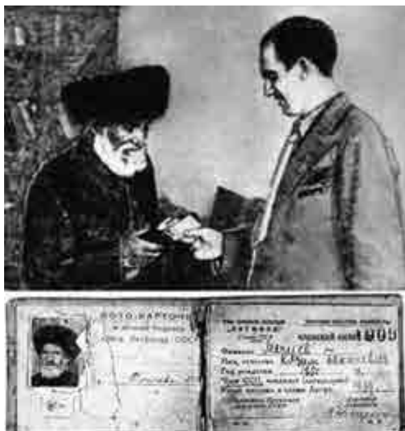
Казим СССР-ни жазыучуларыны Союзуну билетин алган кезиу