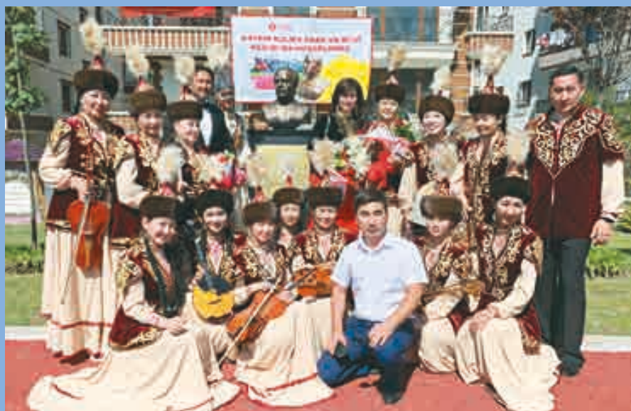
Къзахстанны Къурмангазы атлы кырал академиялы халкъ оркестри