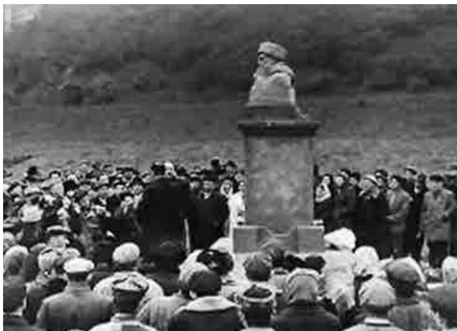
Казимни эсгертмеси ачылган кюн