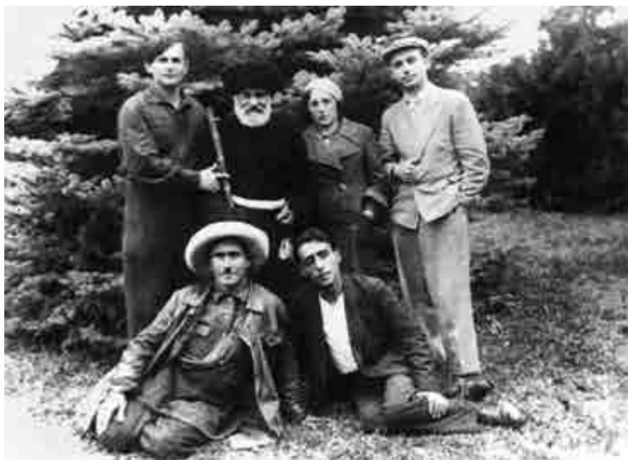
Кязим жаш жазыучула бла