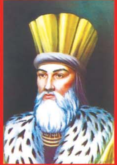
Бэркьюкьюэ Захьир (1382–1388)