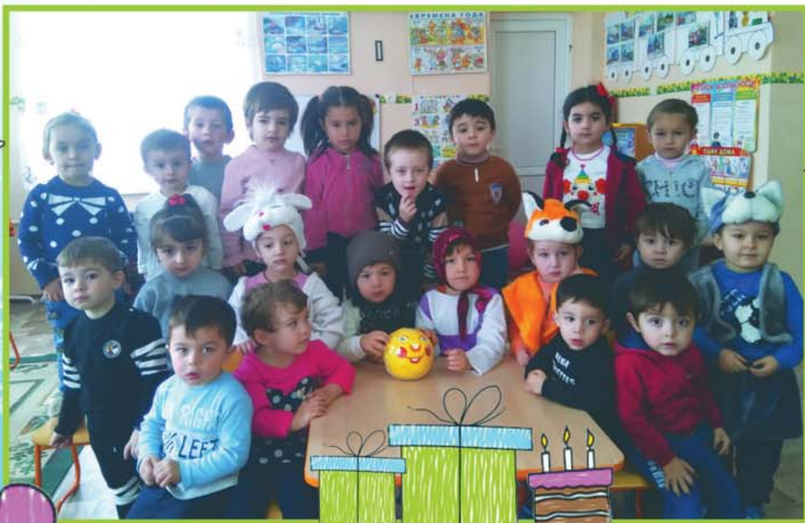
Устазла Уяналаны София бла Хатуқаланы Фатима юйретген сабийле