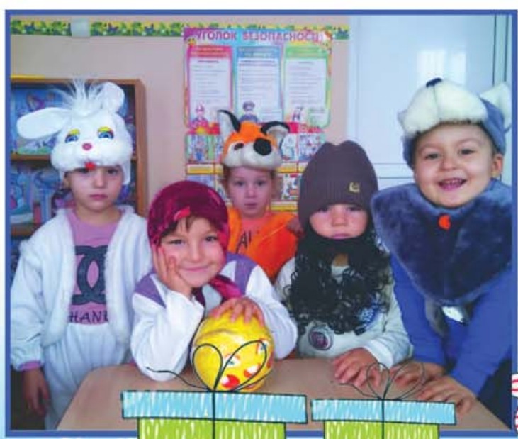
Хабаз элни сабийлери "Театрны ыйыгъында"