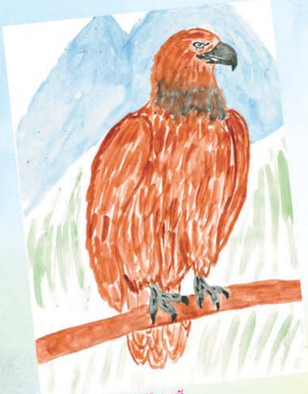
Къулийланы Хусей 5 класс, Экинчи Чегем эл