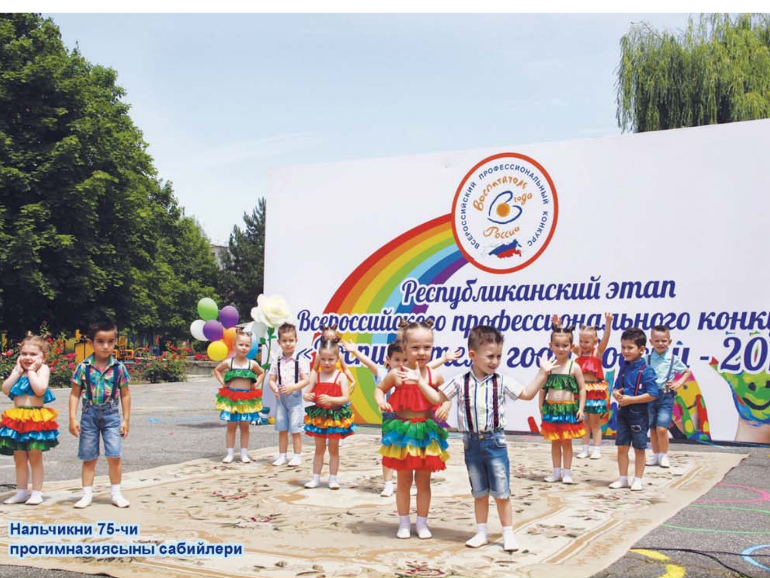
Нальчикни 75-чи прогимназиясыны сабийлери

Багъалы ата-анала, устазла, сабийле! 2019 жылны экинчи жарымына адам аз жазылады деп жарсып турдукъ. Бюгюнлюкде эки мингден ётдю журналны саны. Ол иги шартды. Нек дегенде, "Нюрде" басмаланган затланы сиз бир башха жерде табаллыкъ туююлсюз. Тилни, адепникъылыкъны билирге, тынгылы адам болуп ёсерге юрретеди "Нюр". Мындан ары да журналны алып турлугъугъузгъа ийнанабыз.