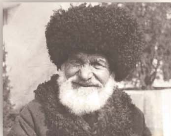
КЯЗИМ МЁЧЮ (1859-1945)