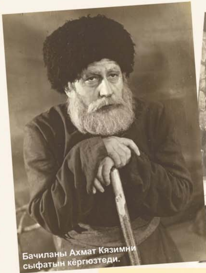
Бачиланы Ахмат Кязимни сыфатын көргюзтеди.