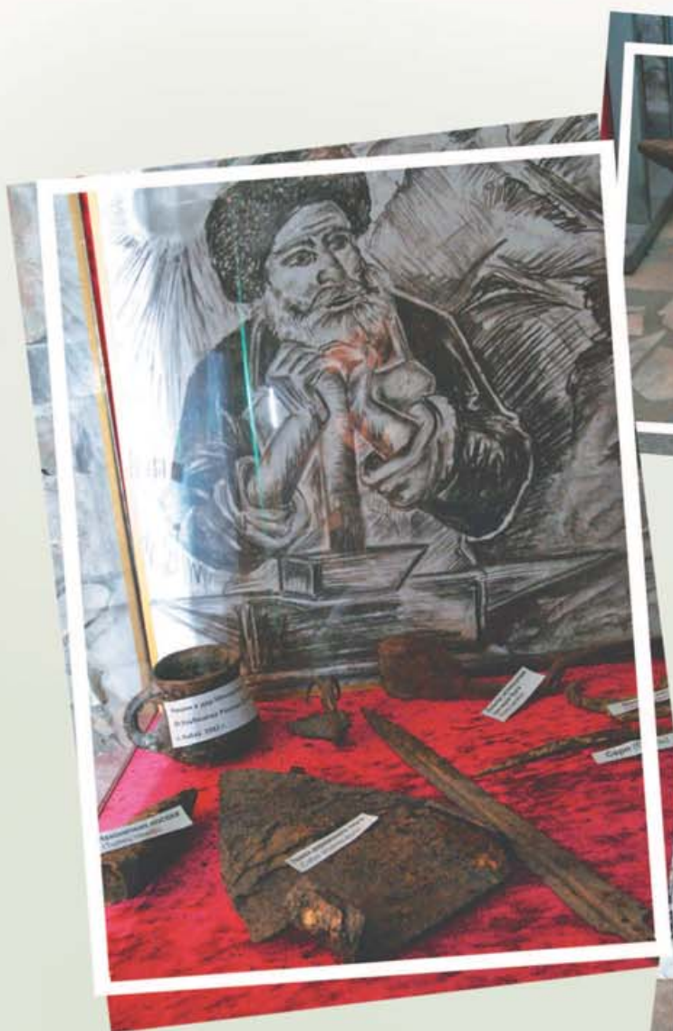
Малкъар халкъны зор бла 1944 жылда кечюрюлгенине аталгъан Мемориалдан суратла.