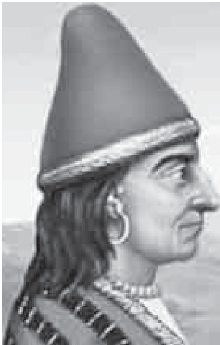
Хъэтыпщ Хъэтусилэ 3-нэ.

– Мы зэанэзэкъуэм сыт унафэу яхуэпщІыну, зиусхъэн? – нэщхъей къэхъужащ щІалэр.