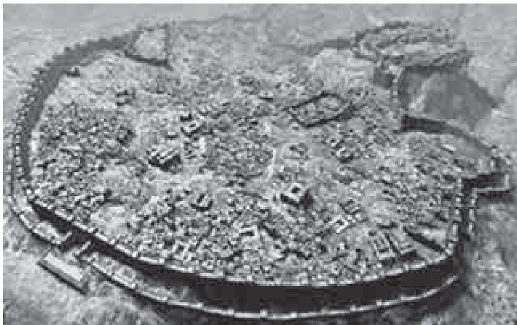
Хьэт кьэралыгьуэм и кьалашхьэ Хьэтуссэ.

Алэдамэ, Хьэтусилэ зэгуэр кьыдэлэпыкьуауэ щыта щхьэхуимыт цыкларум, щларэ ахьырзэман кьыхэклэт. Езы Хьэтусилэ зэрыщларылауэ и зэфларклархэр зэрыщыту бгьэдилхьат лыгьэ кьызылыкьуэкла а щларэ цыкларум. Езым и кьуэ закьуэм – Тутхьэлий – хуэдэу иплат, флыуи ильагьурт. Тутхьэлий кьуэш илэтэкьым, шыпхьуищ мыхьуми, я унагьуэм Алэдамэ кьызэрихьэу, нэхь нэжэгуьжэ кьэхьуат. Щалитлыр тепльэклар апхуэдизклар зэфэгьути, зы адэ-анэ кьамыльхуауэ пхужыланутэкьым. Тлури щларэ лыагэт, лэчльэчт, кьарууфлэт, тепляфлэт, нэжэгуьжэт. Щларэгьуэмрэ лыы пщтырымрэ зэрихьэрт, я гур я бгьэм имыхуэжу. Цыху зэригьэсар кьапщлэу, зэплэзэрытхэт.