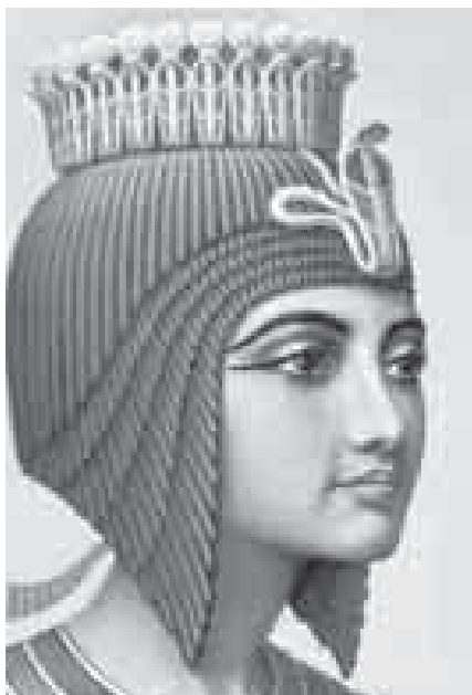
МэIэтхэрнефрурэ – Хьэтусилэ ипхуэ Нэптерэ

– Дэ нэхьфыIыIуэкIэ дыпщыгугъат! Хьуакъым ар, – и напщIэр хишащ Ахей.