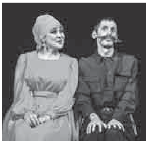
Клэхумахуэ Фатлимэрэ Къардэн Зауррэ «Патлушэрэ Сатлурэ» спектаклым щоджэгу.