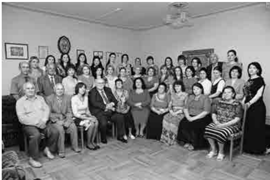
Редакцэм и лэжьакІуэ гупыр. 2014

Зэманыр и Пэм иткъым, гьащІэми кьалэныщІэхэр зэпымыуэ редакцэм и лэжьакІуэхэм я пащхьэ кьрегьэувэ. Ахэр зыгьээщІэфынур нобэрей махуэм и кьэхьукьащІэхэм куууэ пхрыпльыф, зэманым дэбэкуэф цыху гуащІафІэхэрщ. Апхуэдэхэр и мащІэкьым редакцэм. ГьащІэ зылгэгьуа, лэжыгьэм ипсыхьа лэжьакІуэфІхэм я фыгьэкІэ «Адыгэ псалгэм» и псалгэр лэныкьуабэ яхуэщІакьым апхуэдэ мурадкІэ 1992-1993 гьэхэм газетым иужь кьыхьа зэщІэгьэстакІуэхэм. Ар щахузэфІэмыкІым лэпкь газетым и цэр ягьэульиину хуежьат, ауэ абыи зыри кьыкІакьым. Нэхь гьэунэхуныгьэ ткІийхэми ар кьыхьэ-кІащ и щІэми, и нэмысми ІэпапІэ бжыгьэ тримыгьэдзауэ.