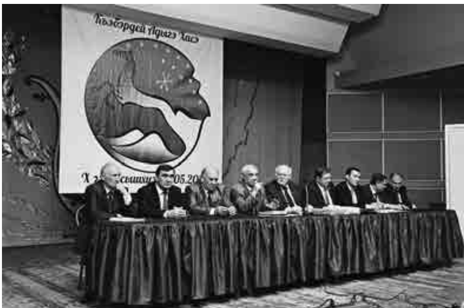
Къэбэрдей Адэгъ Хасэм и зэгуырдæр йокъуæг.