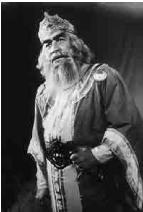
Къаздэхьу СултIан «Тырггьэтауэ» спектаклым Шупашэ и ролыр щеггьэзащIэ.

Апхуэдэ дыдэу ехьулIэны-ггьэ иIэу Къаздэхьум иггьээщIащ ИутIыж Б. и «Эдип» пьесэм кьытраплькIа спектаклым хэт Форбас и ролыр. Ауэ зи гугьу тщIы артистыр нэхъ цIэрыIуэ зыщIар, цIыхубэм ягу кьызынар гушыIэ тепльэгьуэхэм зэрыщыджэгущ. Ахэр нэхьыбэу кьызытраплькIари ИутIыжым и гушыIэ тхыггьэхэрщ: «Жьэмыггьуэ – Африкэм», «Гуащэмьдэхьэблэ», «ГушыIэр гушыIэщ», «ГушыIэ махуэ апщий!», «Хьэцацэ дахащэ». Мы спектаклхэм роль нэхьыщхьэхэр щызыггьээщIар «зэкIэрыпч мыхьун» жыхуаIэм хуэ-