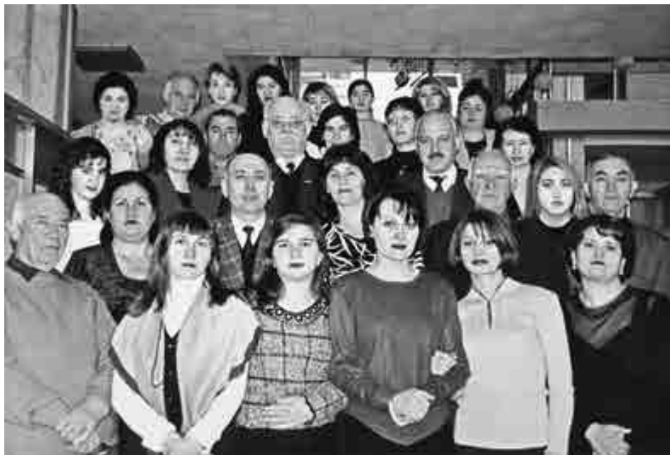
«Адыгэ псалгэм» щылажьэхэр. 2004