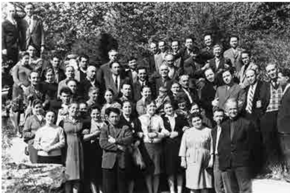
«Ленин гъуэгу» газетым и лэжыакІуэхэр. 1974

30 гъэхэм я пэщІэдзэм ирихьэлІэу областым и экономикэми щэнхабзэми зыкъыІэтащ, щІэныгъэ зиІэхэми я бжыгъэм куэдкІэ хэхуащ. Абыхэм Іэмал къатащ иджыри къэс зэхэту бзитІ-щыкІэ кыдэкІыу щыта «Къэрэхьэлъкыыр» газет щхьэхуэурэ зэгуагъэкІыжыну. 1930 гъэм абы кытехьукІыжащ «Ленинский путь» (иджырей «Кабардино-Балкарская правда»), «Ленин гъуэгу» («Адыгэ псалгэ») газетхэр.