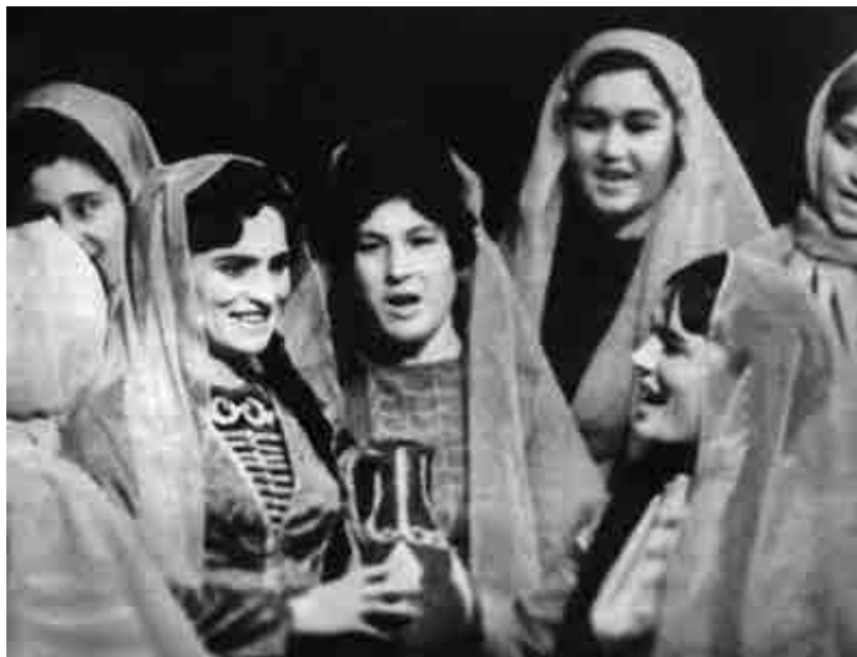
«Мадина» оперэм щоджэгу. 1972

ушыщлэплэклэ, гухэхуэгуэу бгъуэтыр псалэклэ пхужылэнукъым. Дэтхэнэ зыми езым кышыщла гуэр игу кьегэкыж, льягъуныгъэм е фыгуэ зэрылбагъухэр зэпэлэщлэ зэрыхуам теухуауэ жыслэхэм щедалуэклэ. Арагъэнц сценэм зылэпишар, лэгуауэм и лэфыр зыхэзыщлар абы тыншу кышыщлимыкыжыфыр, — желэ Бэгъуэтыжым.