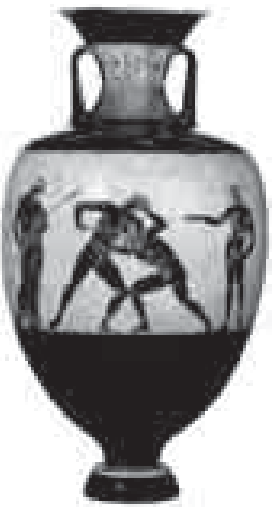
Хабэхуэхуэуэр клэпыллу шьтащ, икИ абыхэм яншыч зым адыгьэбэклэ жиЛэр кхьюэшцын зыгьжым алыдж алфавиткЛэ итхьыжуу арат.

Ди эрэм и пэкЛэ V-VI лэщыгыгүэхэм яшЦау зыхуагыфэщэ кхьюэшцынхэм тетым иджыри кьэс зыри кьеджэфыртокым.