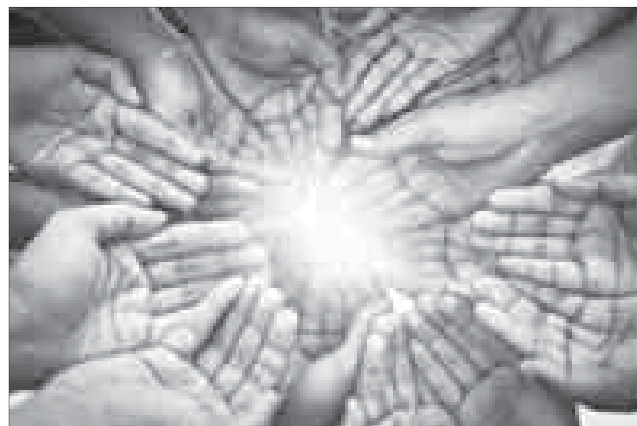
Материалы полосы подготовили Гюльняра Урусова и Басир Муратов.