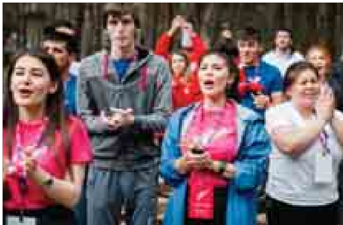
Окончание. Начало на стр. 1

Открылся форум выставкой декоративно-прикладного искусства, где были представлены национальные костюмы, ювелирные изделия, войлочные ковры, музыкальные инструменты народов нашей республики, и «Кругом дружбы» – танцем «Удж», к которому присоединились все участники.