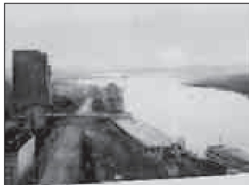
«Солнце восходит над Доном», 2017 г.