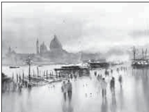
«Закат. Венеция», 2016 г.