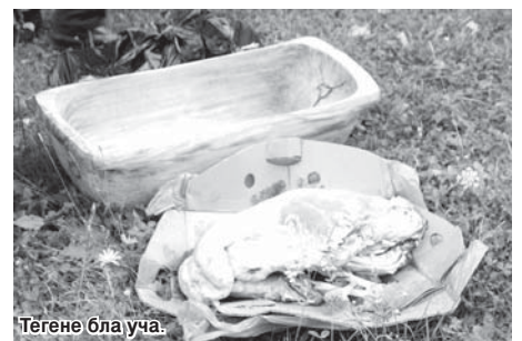
Тегене бла уча.

Кыозудан уча шишлики маллары кыошдан кенге кютген кыойчула биргелерине алып болгандыла. Журтдан