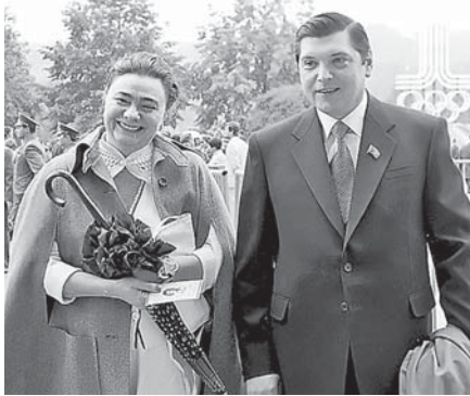
Галина Брежнева эри Юрий Чурбанов бла.

врач болуп ишлеп турганлай, ол арта аны кыарындашын элтюрюрге аздан кыалган тишириуу бла танышханды. Фанни Каплан Кырымга тутмакдан сора кесине бакдырырга келген эди.