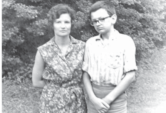
Георгий анасы бла.

Бизни республикада кѳп назму китапланы керти автору эди ол. «ѳтюрюк» китапла