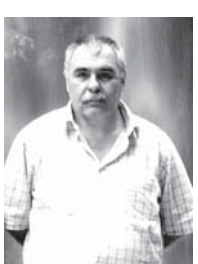
генде, бингысы Тырныауузда приборла ишленген чекте кыайтама. Аны бла бирге окурга кыМКМЪу да инженер-техника командасына сабында ойнаганды.

Ызы бла бизни Якутияда Тикси портада узак авиацияны акерине кёчюрөдиле. Усталыгымы жарата эдим, кылуугум да тын эди. Болжым жет-