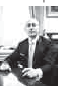
Он жыл бола эди алай зат этилмей турганыла. Душла, тешинучо отоула дегенча затыбыз жок эди да, анга да