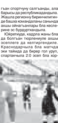
уа тыш жерде осал ойнаганылары била белгилдиге – бир оюнларны ала тенг эсеп била болбашырилеринде кесинде

Профессионал футбол лиганы биринчилигини 19-чу турунда «Спартак» Нальчик биринчи матчы «Краснодар-3» команда била кесини майдандында бардырылды. Бусагытта бизникиле турнир таблицада - сегизинчи, кыонакчыла уа онекинчи жердиле. Нальчикиле ары дерин ахыр юкюбашырилеринде кесинде хорлагандыла, краснодарчыла