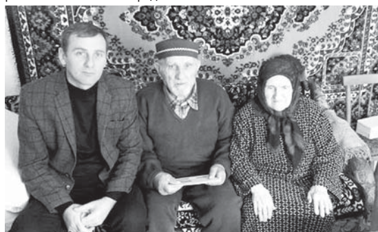
Атырзаланы Марат Байчекчуланы Махмутха Россейни Президентини эмда КМР-ни Башчысыны алгышлау кыагытларын берген кезиуде. 2018 жыл.

Сёз ючюн, Малкыар халкыны кыайралгыты кыайтарылган кюнге аталган кыуанчлагача хазырланганды, аланы бардыргача, байрамгача аталган чаришлени кыурагача да халкы бирча болушхандыла. Жамаутны кыармашыуу бла байрамыбыз иги болганды.