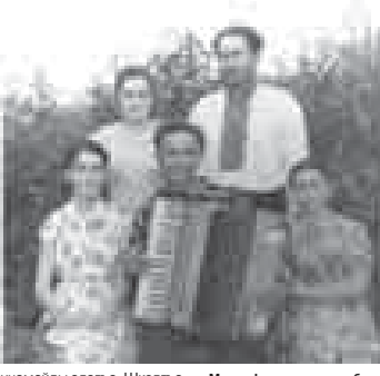
Мустафир ахлулары бл.

Оккуп бошгандай, Мустафирни Кыбарты Малквар телевиденияга журналисттерини кыулугуна аладыла. Ол анда сау кыаркык жыл ишлегенди, дуниясы алышханы. Анга берилген, бир кюн жетемген алтмыш жылы ичинде этген иши бла аруу ыз кыойганды композитор. мурзакане не торлю жарында да фахмурун көргөзгөндө. 1976 жылда аны Россияни Композиторларыны союзун алгандыла. 1990 жылда уа «КМР-ни искусстволарыны сыйлы кыулукчусу» деген ата тийишли көргөндө.