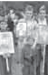
Зайлиханланы Кыаншауыбыны району аскер махтаулыкуну жерлерине төрели автопробеи башлагыра белги бергенден сора РОСТО ДЮСААФны машина колоннасы, эки кыауумга ююешин, жогыра чыкканды. Аладан биринчи «Тырынуз-Огыры Бахсан-Элбрус-Терс-Кыюл-Тырынуз», экинчиси да – «Тырынуз-Быллым-Бедик-Лашукта-Кенделен-Тырынуз» маршрутла баргандыла, эсгертилеге голле салгандыла.

Женетли болсун, 2007 жылда ауушанды. Болсада биз аны унутмагандыла, ма параддан сора ююне барлыкбыз», – дейди ол.