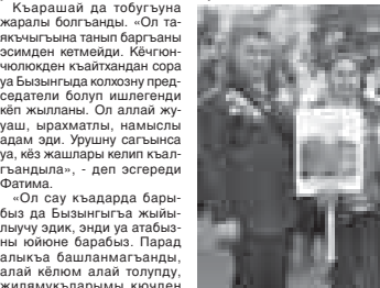
Халпаланы Кыарашайны эм Шауаланы Жибрилни тудуусылары бла аладан туугандыла.

Женетли болсун, 2007 жылда ауушанды. Болсада биз аны унутмагандыла, ма параддан сора ююне барлыкбыз», – дейди ол.